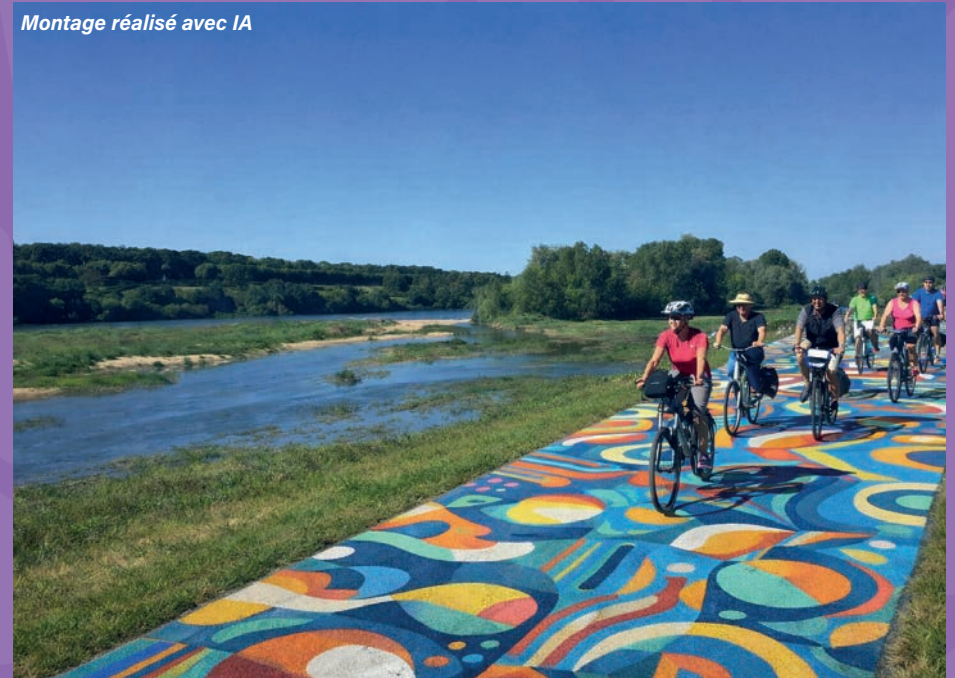
Montage réalisé avec IA