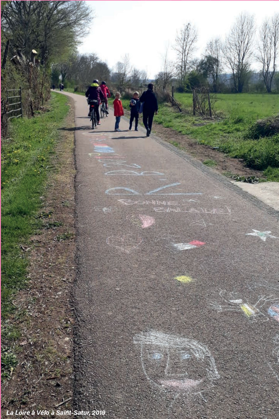
La Loire à Vélo à Saint-Satur, 2019