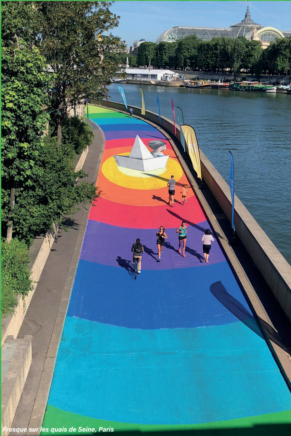
Fresque sur les quais de Seine, Paris